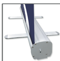
Roll Up Kassette