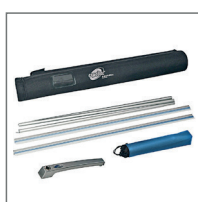
Nylontasche optionaler Strahler