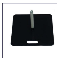
BF-HQ-BP stählene Bodenplatte 40 x 40 x 0,5 cm, 10 kg In-/Outdoor