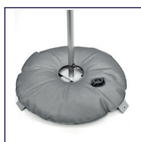
BF-HQ-BR befüllbarer Reifen als Zusatz für Kreuzfuß In-/Outdoor