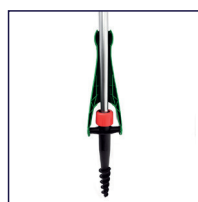
BF-HQ-EB Erdbohrer (Outdoor)