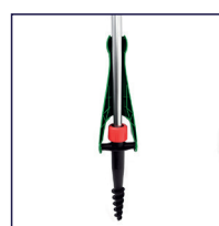
BF-HQ-EB Erdbohrer (Outdoor)