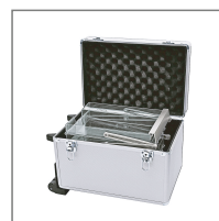
Hardcase Nr. 2101