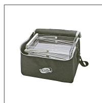
Softbag Nr. 2100